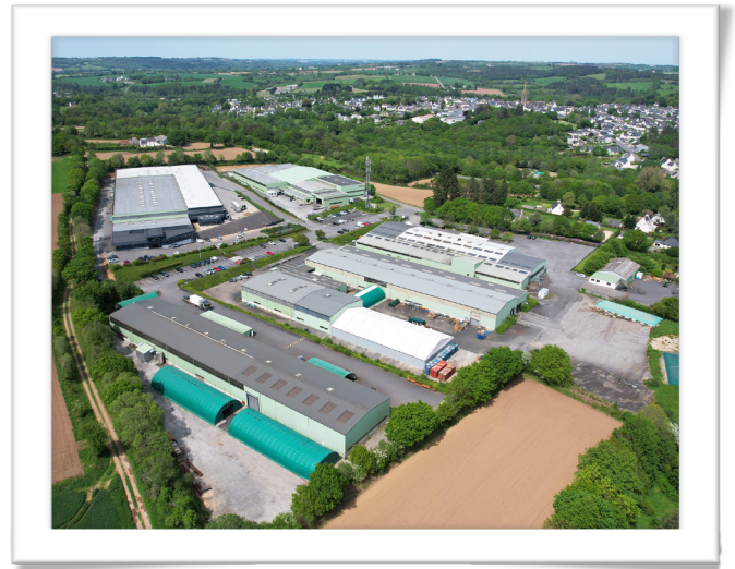
Site MAGSI - Sizun, Finistère

Une équipe dynamique, réactive, à l'écoute des besoins de ses clients, qui propose des solutions de manutention adaptées aux contraintes du quotidien. Une partie de notre équipe commerciale est sédentaire, les clients ont donc un interlocuteur privilégié, réactif et à son écoute. Notre gamme est commercialisée exclusivement en BtoB. L'entreprise se distingue par la qualité de ses produits et de ses services.